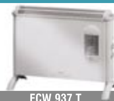
ECW 937 T