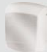
HD 601 AM