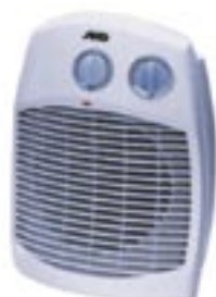
SH 301 TLS