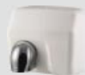
HD 701 AM