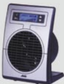
H 401 TSD