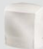
HD 501 AK