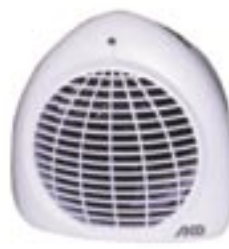
H 380 TLS