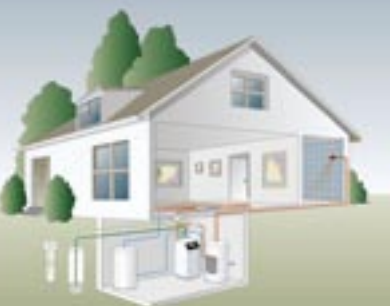
ΝΕΡΟ - ΓΕΩΘΕΡΜΙΑ