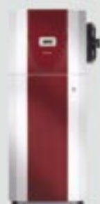
A/Θ Αέρα - Νερού