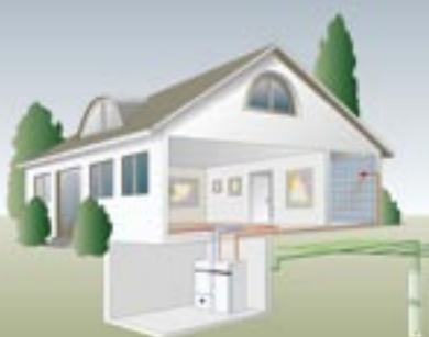
ΕΔΑΦΟΣ - ΓΕΩΘΕΡΜΙΑ