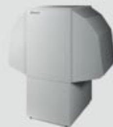
A/Θ Αέρα - Νερού

Ποιότητα, στην οποία μπορείτε να βασιστείτε: Οι Αντλίες Θερμότητας Dimplex κατασκευάζονται στην Γερμανία με γνώμονα τις καινοτομίες και τα χαρακτηριστικά απόδοσης, τα οποία έχουν ήδη πείσει χιλιάδες πελάτες εδώ και χρόνια. Οι Αντλίες Θερμότητας Dimplex έχουν ωριμάσει ως προϊόντα: υψηλότερες τιμές απόδοσης, εργονομική άνεση χειρισμού, μακροχρόνια ασφάλεια λειτουργίας, μεμονωμένη επιλογή συστήματος, πλήρες πρόγραμμα εξαρτημάτων και εγγύηση ανταλλακτικών.