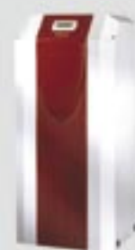
A/Θ Εδάφους - Νερού